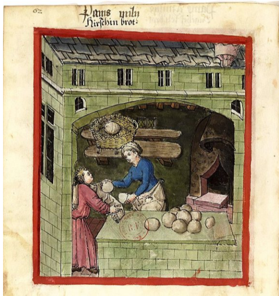
La présence de boulangères au Moyen Âge est visible et attestée. Ici une copie latine d'un traité médical et de diététique arabe.

Dans les ruines d'Avenches, l'étude des graffitis sur céramique révèle 80 noms masculins contre 27 noms féminins. Et les 214 inscriptions sur pierre retrouvées sur sol vaudois présentent un rapport de 3 à 4 noms masculins pour un seul nom féminin. «La présence et la voix des femmes dans l'histoire ont toujours été concrètement et symboliquement menacées de disparition», explique Valérie Cossy, professeure en études genre à l'Univer-