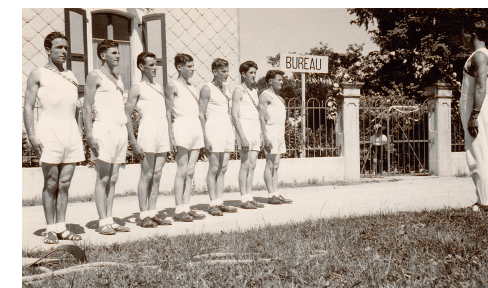
La gymnastique au XX e siècle : de l'exercice militaire à la pratique ludique. Fête régionale 1952, Yvonand : la section de Montagny, garde-à-vous, sautoir, olympiques et cuissettes.