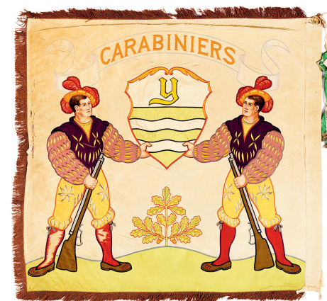
Un autre exemple de conservation du patrimoine des associations. Drapeau de la société des carabiniers (revers). Collections du Musée d'Yverdon et région.