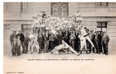
D'un sport fédéral à une pratique cantonale au XIX e siècle. Section lausannoise de la Société fédérale de gymnastique, carte postale, vers 1900, coll. du MHL.