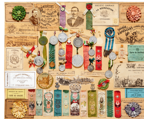
Assemblage de médailles, photographies et annonces. Archives de la Ville d'Yverdon-les-Bains.