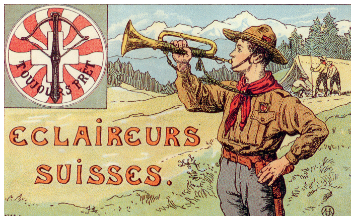
Au carrefour de plusieurs mondes associatifs : la création du scoutisme vaudois. Carte postale des éclaireurs suisses vers 1919. Archives privées.

Ce numéro propose aussi dans sa partie mélanges, une étude inédite sur les seigneurs de Cossonay et leur comptabilité au XIV e siècle.